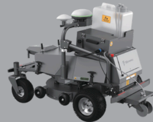
LM02 (Alleen markering)